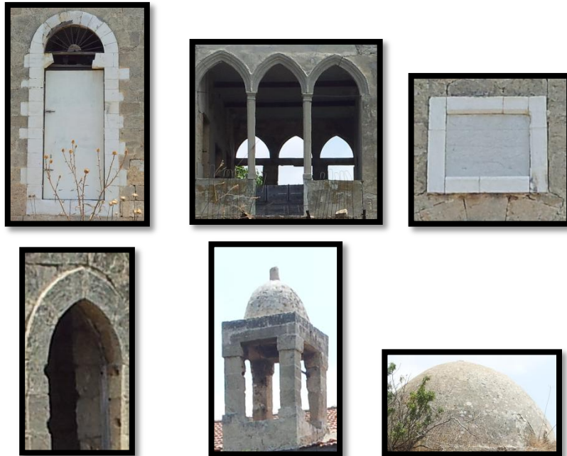
חפשו בכפר את הפרטים הבאים:

במקום עיירת העולים שלומי היה בעבר הכפר באסה (בצה). תושבי הכפר הנוצרים, שהיו רוב אוכלוסיתו, רצו בשלום עם השכנים היהודים החדשים. חנן, חבר קיבוץ מצובה, שהיה שומר השדות בימים ההם, מספר כי בדרך כלל היו יחסי שכנות טובים בין תושבי הכפר לישובים. היה מסחר הדדי, בנאי באסה לימדו את אנשי המשקים לבנות באבן מקומית, אנשי באסה באו למשקים לביקורי חג, והללו השיבו להם ביקורים בימי חג נוצרי ומוסלמי. עם קום המדינה הושיבו בשלומי קבוצת יוגוסלבים ואחרי כן תימנים, כדי שיתפרנסו בה מחקלאות. אחר שהתברר שאין האדמות מספיקות לקיבוצים הותיקים ולמושבים החדשים שהוקמו באותו זמן, נעשתה באסה לעיירת עולים מצפון אפריקה. בין עכו לראש הניקרה, יהודה אריאל, עמ' 44-45