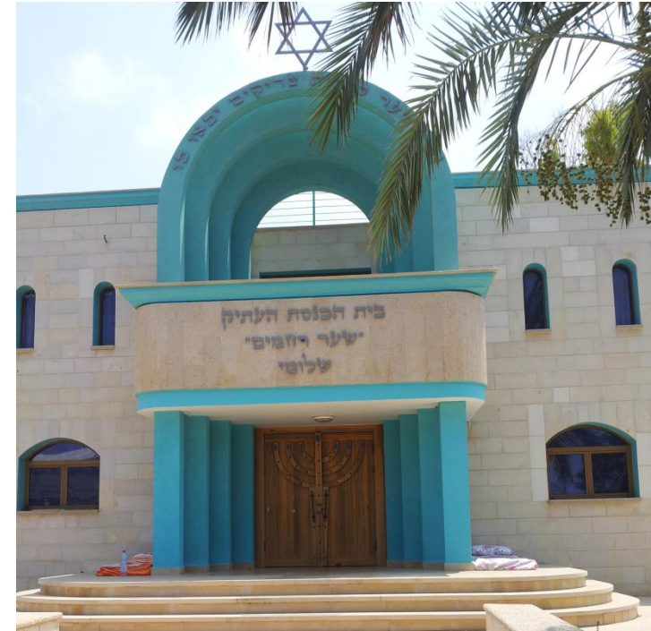
היכנסו פנימה והסתכלו סביב.